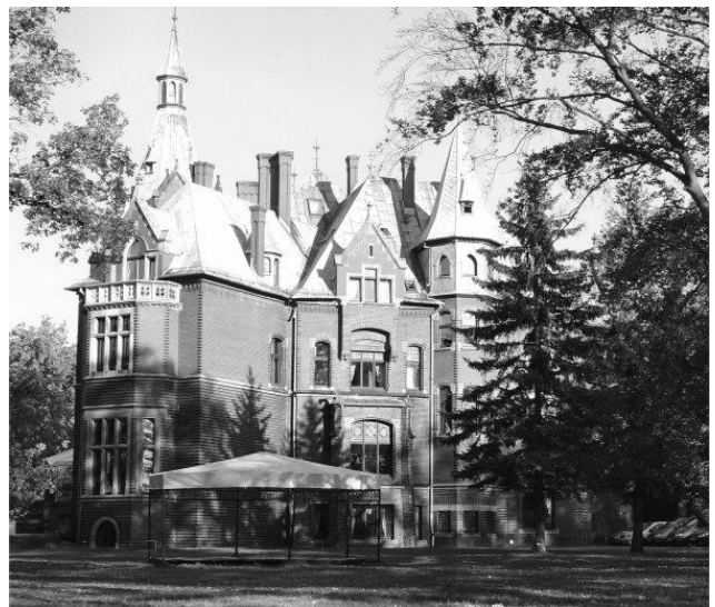
Pałac w Wąsowie