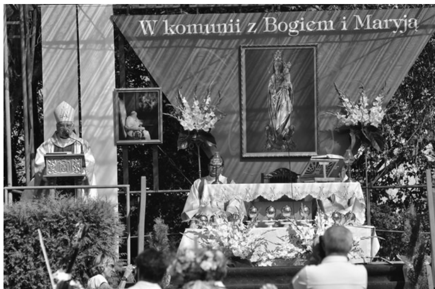
← Pielgrzymka do Tulec 2011