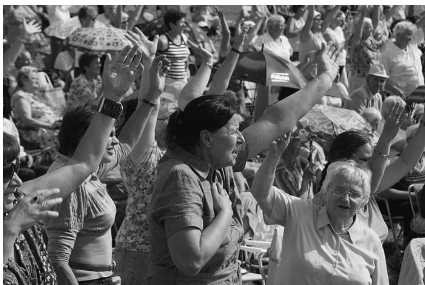
← Lednica Seniora 2011