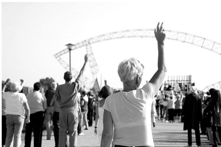
Lednica Seniora 2011 →