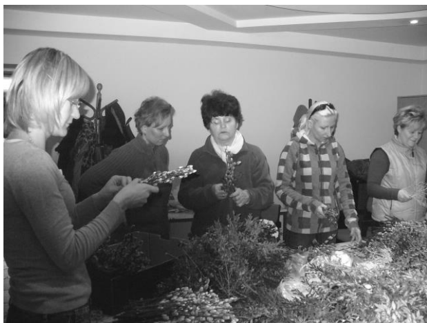
← Prace podczas wiązania palm