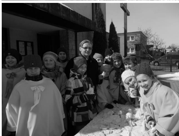
Dar serca dla dzieci z Domu Pokoju z Jerozolimy